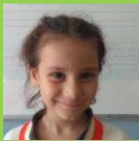
CUD EL ŞAM DEH